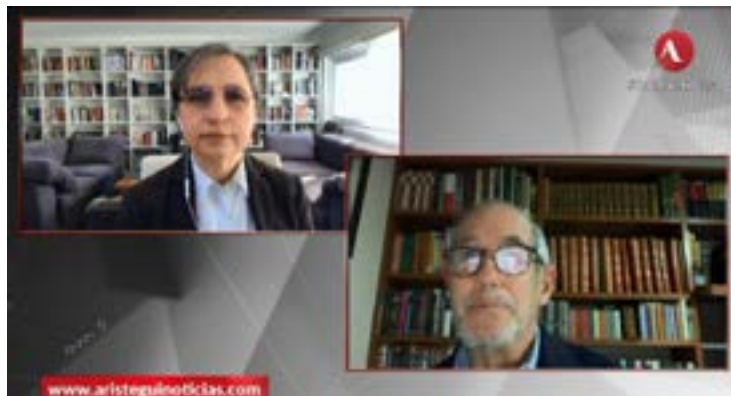
Carmen Aristegui durante su entrevista con Juan Luis Arzoz.

Desde antes de la pandemia la industria editorial mexicana ha visto merma una de sus fuentes de ingresos, con los recortes a cultura. Frente a ello, hay iniciativas para reactivar la industria, como la compra de acervo por parte del gobierno a editoriales, para nutrir el acervo de las bibliotecas públicas: “Los apoyos del gobierno han estado limitados, estamos realizando propuestas en áreas donde el Gobierno sí puede aportar al desarrollo de la industria. Hay un proyecto: son 7 400 bibliotecas en el país en números redondos, y una de nuestras propuestas es renovar los acervos, revisarlos. Es importante, hacerlo de forma continua da ingresos a las editoriales del país, y las bibliotecas son un espacio de acceso gratuito a los lectores”.