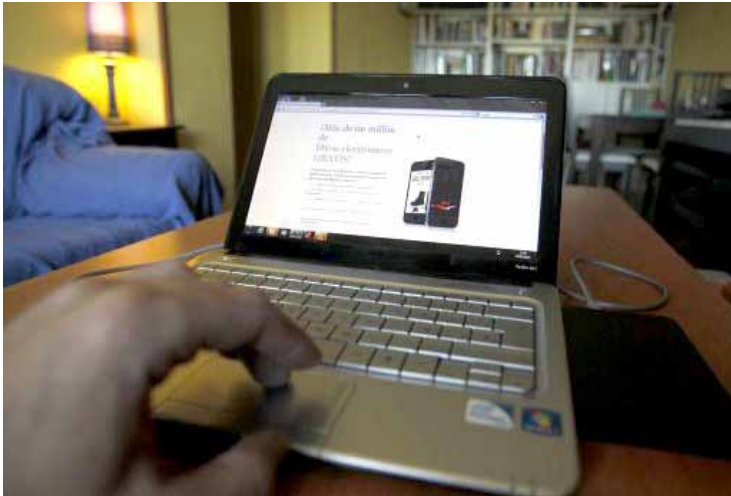
Una persona se baja libros de forma gratuita desde su ordenador personal.

⇒ Vargas Llosa teme que el libro electrónico entierre al impreso