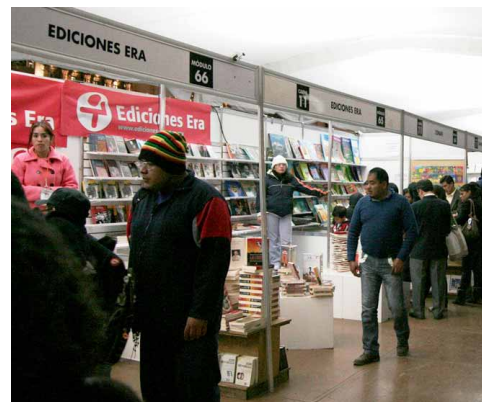
Feria del Zócalo

La mayoría de los consultados confirma que su venta, en algunos casos y fondos, se duplicó. Otro más aseguró que pudo colocar títulos que el año pasado no fueron exhibidos.