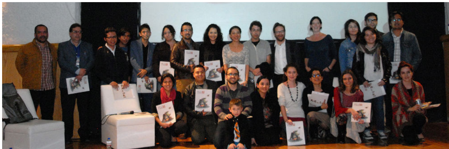
Diseñadores e ilustradores ganadores de los premios convocados por la FILIJ

Los carteles e ilustraciones se exhiben en una exposición montada a lo largo de la Feria Internacional del Libro Infantil y Juvenil, y en el Teatro de las Artes del Cenart.