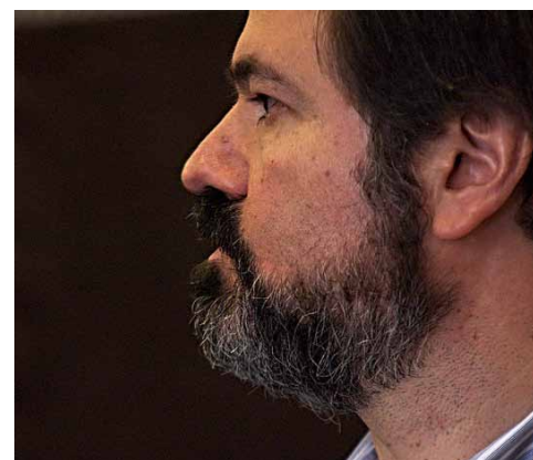
Juan Villoro.

Amante de la música, condujo de 1977 a 1981 la emisión El lado oscuro de la luna , en Radio Educación. Fue agregado cultural en la Embajada de México en Berlín entre 1981 y 1984. Ha sido profesor de literatura en la Universidad Nacional Autónoma de México y profesor invitado en las universidades de Yale, Boston, Pompeu Fabra y Princeton. Es colaborador de publicaciones como El País , ABC , El Malpensante , Letras Libres , Nexos , Proceso , entre otras. Dirigió el suplemento cultural La Jornada Semanal de 1995 a 1998. En 2004 recibió el Premio Herralde por su novela El testigo .