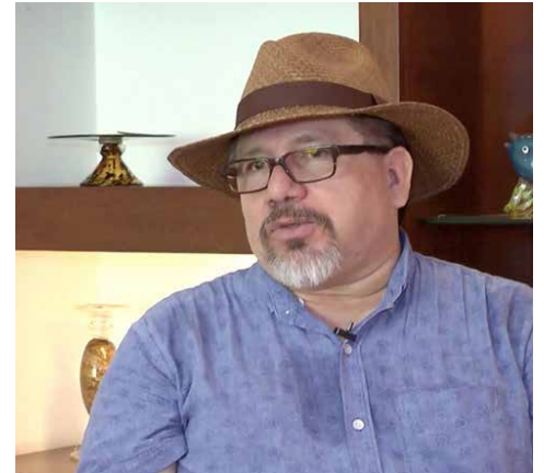
Javier Valdez Cárdenas.

Los abajo firmantes, periodistas, editores, escritores y simples ciudadanos hacemos un enérgico llamado a las autoridades a esclarecer este arte-ro crimen y a garantizar la vida y el trabajo de la prensa en México.