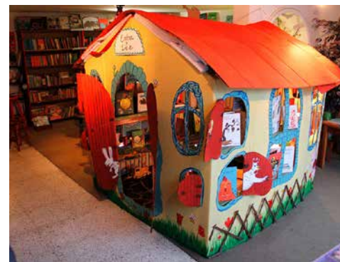
"Entra y lee".

¡Que participen! Que inventen; que es muy divertido, independientemente de ganar o no, hacer un trabajo juntos, creando, y que ver a la gente acercarse a algo con el entusiasmo que han generado como equipo, ya es una gran satisfacción.