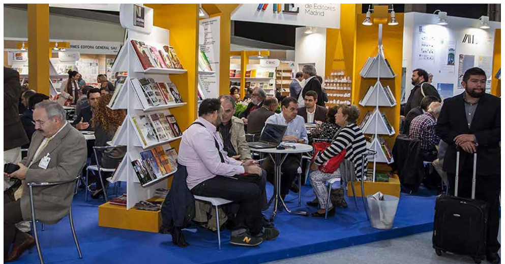
Feria Liber 2016.

Durante los tres días que durará la Feria, se tendrá la presencia de editores, autores, librerías, distribuidores y otros profesionales de la industria. También estarán presentes los grandes sellos editoriales españoles e internacionales. Liber será