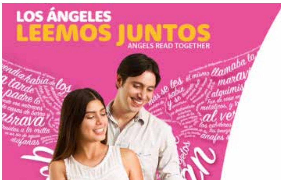
Publicidad con la que se promovió la Feria LéaLA en 2015

* Con información de Virginia Bautista / Excélsior