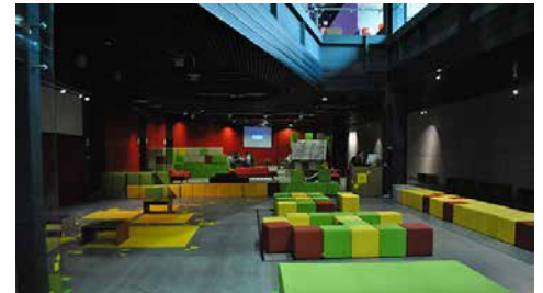
Centro de Cultura Digital.

Dirigido a autores, editores, storytellers en general para dar a conocer la plataforma que ofrece Beemgee para armar una historia de manera profesional y compartirla entre los interesados clave de la industria editorial, cinematográfica y del videojuego. Habrá un concurso para seleccionar una historia que,