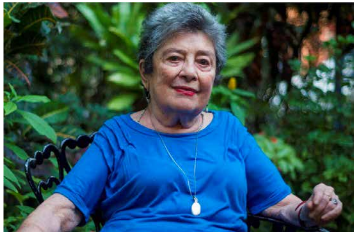
Claribel Alegría.

En la obra de esta poeta son habituales las alusiones mitológicas y se consideró un reflejo de la Generación comprometida, la corriente literaria que se impulsó en Centroamérica en los años de 50 y 60, algo que ella rechaza: "Es muy tremendo decir poesía comprometida porque la poesía yo no la quiero