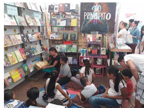
Dinámicas de lectura organizadas por Librería Biulú.

Considero que fue una propuesta para la que el público no estaba preparado. La feria hace una oferta por editorial y al llegar a nuestro stand no alcanzaban a entender del todo de qué iba la propuesta, aun cuando teníamos la lona promocional y los letreros con los temas. Entonces se acercaban, pero buscaban temas de entretenimiento. Aunado a eso, la asistencia fue menor a la de otros años, pues acapararon la asistencia y la atención de la ciudadanía la inauguración del Polyforum Cultural Mier y Pesado, simultánea a la Feria, y la contienda política en el municipio, a pesar de