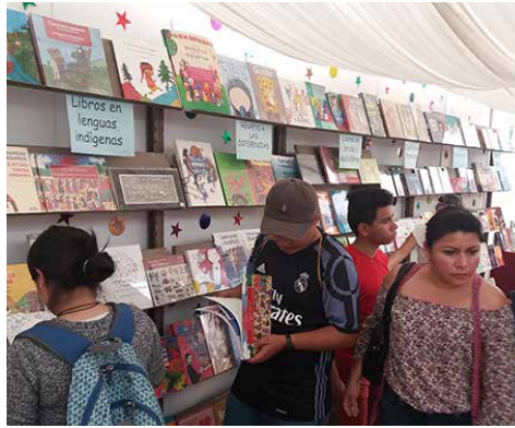
Los visitantes a la filo 2017 se mostraron interesados en la oferta de "Libros para Todos".

Agradezco la oportunidad y todo el apoyo recibido por Ixchel Delgado, así como la confianza y disponibilidad de las editoriales para enviarme sus materiales de gran calidad.