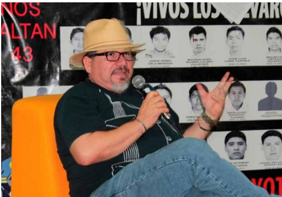
Javier Valdez Cárdenas.

Cayuela comentó a la UIE a través de correo electrónico: "Teniendo en cuenta lo que está pasando en México, sería ingenuo pensar que los editores no corren ningún tipo de riesgos mediante la publicación de libros de periodismo de investiga-