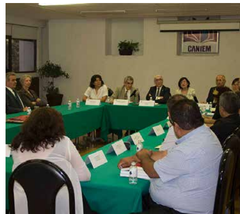
Editores mexicanos y prensa peruana en el Salón Ángel González Avelar.