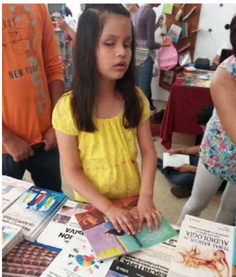
"Libros para Todos" incluye material en braille.

Háblanos de una experiencia que te haya impactado durante la FILO 2017 con este proyecto.