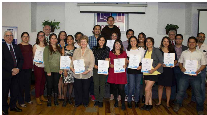
Alumnos y profesores de la xxvii Beca Juan Grijalbo-Secretaría de Cultura.

Como ya es tradición en cada generación, un alumno es el encargado de dirigir un discurso a nombre de sus compañeros; en esta ocasión el encargado