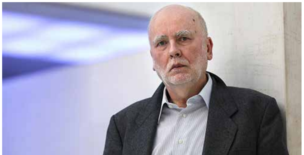
Adam Zagajewski.

Cada uno de los Premios Princesa de Asturias está dotado con una escultura de Joan Miró, símbolo representativo del galardón, 50,000 euros, un diploma y una insignia. Los galardones serán entregados en otoño en Oviedo, en un solemne acto presidido por los reyes de España, Letizia y Felipe VI.