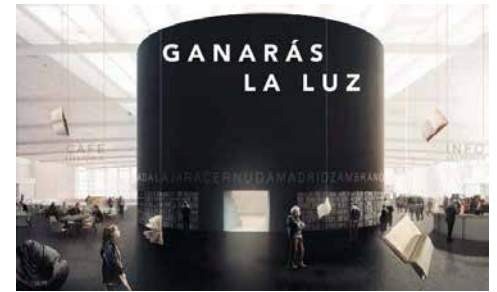
Maqueta del Pabellón Madrid en la FIL Guadalajara, obra de Alberto Campo Baeza. Foto: Prensa FIL Guadalajara Guadalajara

En un comunicado, la FIL Guadalajara señala que una de las actividades centrales del Pabellón será la exposición “Pongamos que hablo de Madrid”, que exhibirá lo mejor de su literatura contemporánea, pinturas, fotos, collages y otras formas