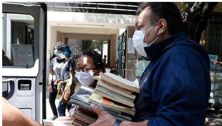
Vecinos y brigadistas voluntarios trasladaron el material bibliográfico a la Casa Refugio Citlaltépetl.