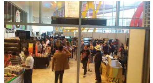
El público asistente a la FEL Chihuahua 2017 podrá encontrar la oferta de más de 60 editoriales

La FEL cuenta con 16 talleres creativos y literarios para todas las edades, 37 presentaciones de libros, ocho conferencias, además de ponencias y presentaciones. En estas actividades se tiene programada la participación de más de 60 escritores de diferentes partes de la República Mexicana.