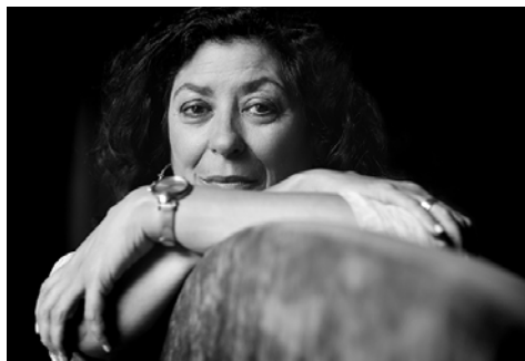
Almudena Grandes.

Con la conferencia magistral “Mirar al mundo”, en la Cátedra Latinoamericana Julio Cortázar, Almudena Grandes quien es considerada una de las autoras españolas más relevantes de la actualidad, participará como parte de la delegación de Madrid, Invitada de Honor de la Feria Internacional del Libro de Guadalajara. La cita será el 28 de noviembre próximo a las 12:00 horas, en el Paraninfo Enrique Díaz de León, en Guadalajara.