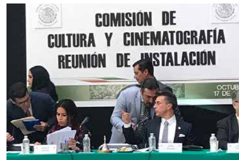
Sergio Mayer, durante la instalación de la Comisión de Cultura y Cinematografía.