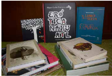
Parte de los libros premiados este año.

El maestro Xagah la ayudará a transitar por el mundo de los sueños, pero esta vez, Erith estará sola para enfrentarse a las revelaciones que el soñar trae consigo. Su reto será recordar y no olvidar, pero ¿cómo?, si la verdad duele; si esconde rescoldos crueles de recordar; si Arkid sólo es el eslabón de un pasado que duele tanto.