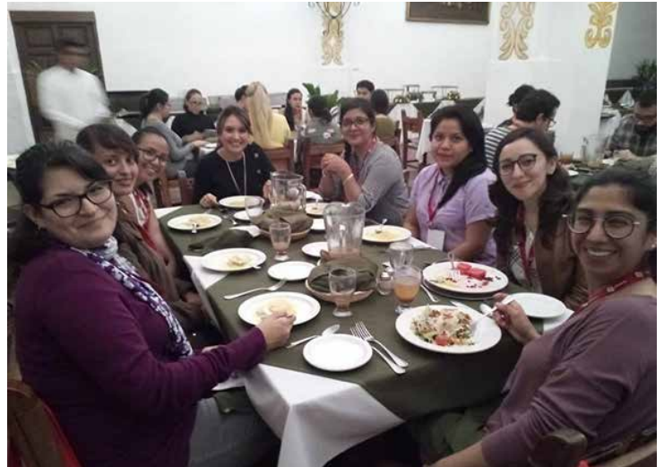
Parte de los participantes en la BJK.