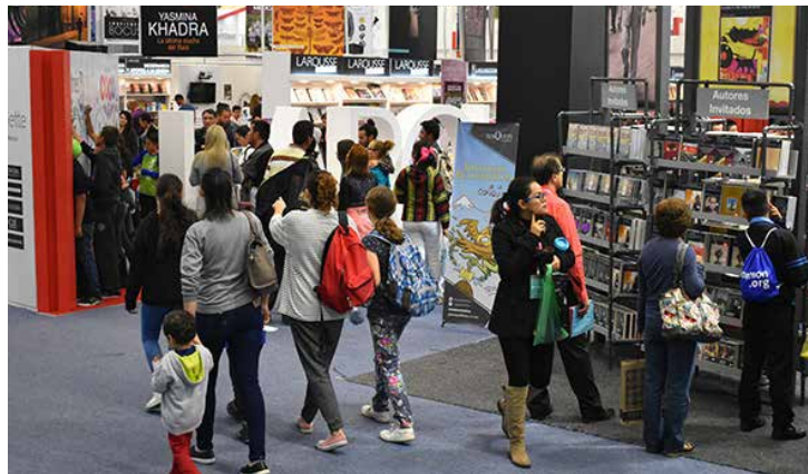
La FIL Guadalajara se realizará del 24 de noviembre al 2 de diciembre.

* Con información de Prensa y Difusión FIL Guadalajara