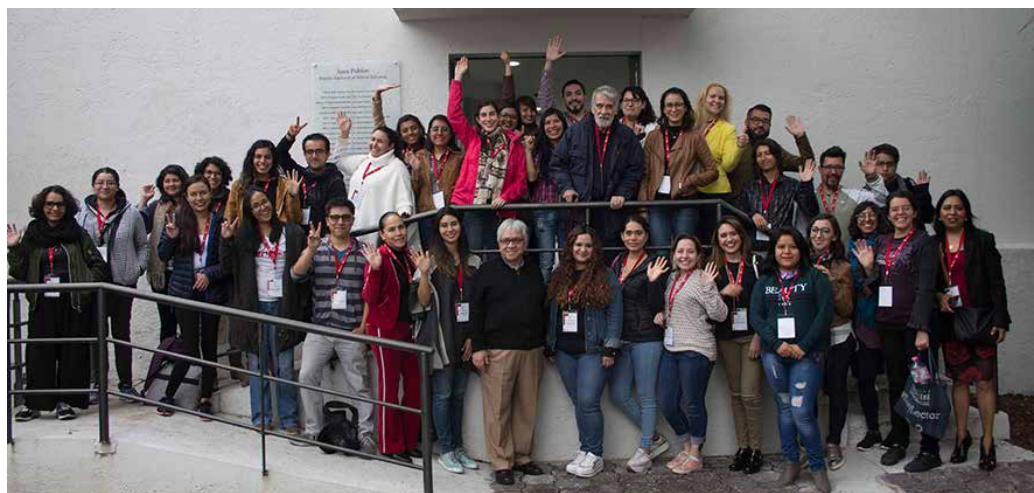
Grupo de participantes en la XXIX Beca Juan Grijalbo.

Una primera fase de preparación comenzó un mes antes, con la finalidad de favorecer un piso de entendimiento mutuo, conceptual, teórica y técnicamente. La segunda fase, que inició el pasado domingo 21, se realizará durante una semana y está integrada por 48