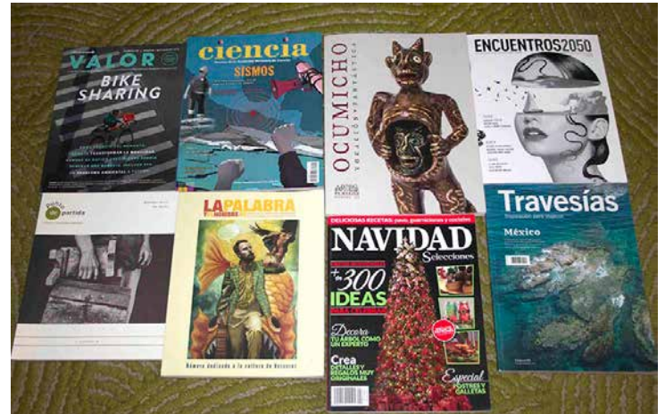
Revistas ganadoras en alguna de las categorías de Publicaciones periódicas.

Travesías (Travesías Editores). Es una revista de viajeros que buscan descubrir el “otro lado” de la Ciudad de México, o de otro lugar a miles de