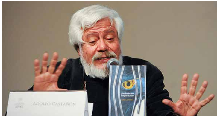
El escritor es ganador del Premio Alfonso Reyes.

La Cámara Nacional de la Industria Editorial Mexicana y su Consejo Directivo felicitan al narrador, ensayista y poeta mexicano