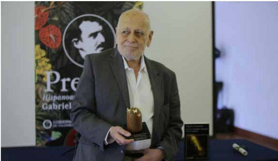
Edgardo Cozarinsky

La Biblioteca Nacional de Colombia lo describió como un libro inquietante que explora varias dimensiones de lo imaginario: “En Buenos Aires los muertos sobreviven en una precaria segunda vida; en la selva guaraní o en las ruinas de Angkor palpitan, invictos, los sacrificados. Y en un rincón de Brooklyn opera una vidente que puede transformarse en la madre del incauto que se anima a consultarla”.