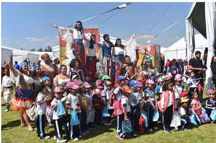
Parte del equipo que ameniza las actividades en la FILIJ.