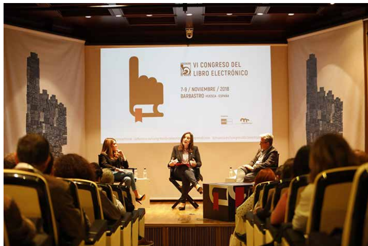
Actividades del Congreso.