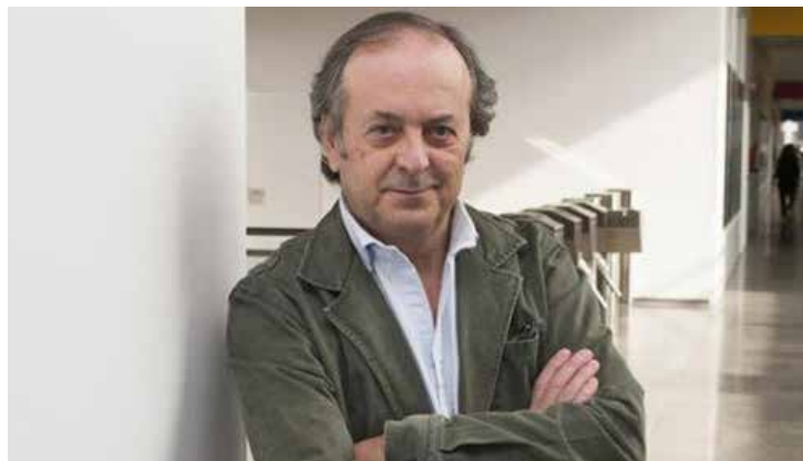
Miguel Barrero.

El nuevo presidente inicia su mandato con varios objetivos destinados a conseguir que el sector editorial español se mantenga como la principal industria cultural española y una de las más importantes del mundo. “Los ejes a los que dirigiremos nuestra labor se estructurarán en cuatro áreas: en primer lugar y dentro del ámbito social, el fomento del libro y la lectura, la comunicación de la función del editor, la lucha contra la piratería y la defensa de la creación intelectual; en segundo lugar, la mejora de la internacionalización del sector para crecer en otros mercados así como reforzar nuestra presencia en las instituciones europeas; en tercer lugar, colaborar con todos los agentes de la cadena de valor del libro y la defensa de un tejido de librerías y un mapa de distribución que garantice el acceso a la lectura; y, por último, en el ámbito institucional, hacer realidad los puntos que estructuran el Plan de Fomento del Libro y la Lectura aprobado en 2017 (empezando por la compra de ejemplares para las Bibliotecas). Trataremos de, en tiempos de cambio e incertidumbre, mantener una actitud de colaboración constante (con instituciones, organizaciones del libro, administraciones, autores, lectores, bibliotecas, colegios, libreros, distribuidores...) y de comprometernos con las situaciones específicas de los distintos tipos de edición, así como con las circunstancias de las distintas Asociaciones territoriales que integran la Federación”.