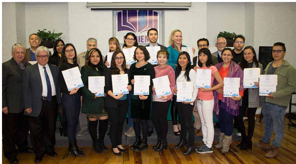
Participantes de la Beca Juan Grijalbo en su edición XXIX.