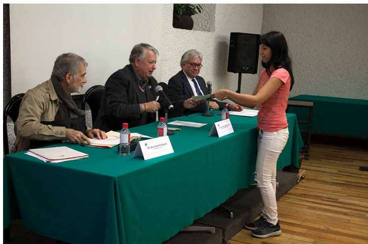
Uno a uno, fueron pasando los participantes por su reconocimiento.

Invitamos a los interesados en participar en este seminario para 2019 a solicitar informes en horas de oficina con Leticia Arellano, al teléfono 5604 3294 (directo), o al conmutador: 5688 2011 ext. 728, o bien al correo: capacitacion@caniem.com