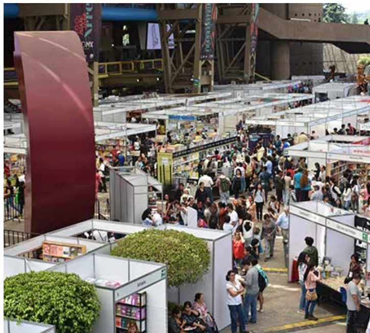
12ª Edición del Gran Remate de Libros.

El Gobierno de la Ciudad de México, a través de la Secretaría de Cultura, agradece al Auditorio Nacional por albergar ediciones pasadas del Gran Remate, que durante más de una década ha buscado reactivar la industria editorial del libro rezagado y fomentar la lectura con precios que superan descuentos del 50 por ciento.