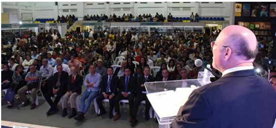
La FeliUAS 2019 fue una verdadera fiesta del libro.

“Se espera generar una dinámica en todo el país para que se modifique el hábito de lectura para bien, y así como el mexicano no teme a las armas, que tampoco le huya a tener un libro en la mano, la idea es convertir las bibliotecas en centros culturales, centros donde se oriente a la sociedad en el conocimiento”, expuso.