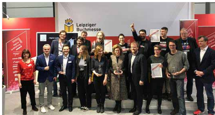
Los ganadores del premio a la Edición digital 2019.

Además, servicios como "We Audiobook You" (Bookwire) o "Book Sprints", que tienen por objeto eliminar los déficits del mercado, también han sido