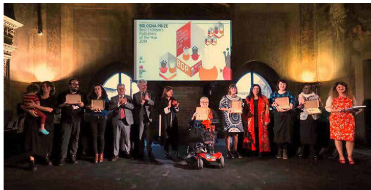
Ganadores y presentadores en los premios de los editores de la Feria del libro infantil de Bolonia.

Para África, el ganador fue Editores subsaharianos, Ghana, fundada en 1992 y especializada en libros para niños que tratan temas ambientales. Para Asia, el premio fue para la empresa de publicaciones Locus de Taiwán, fundada en 1996. Sus publicaciones tienen como objetivo captar el espíritu de "futuro, cultura de aventura". Para Europa, el ganador fue la empresa portuguesa Orfeu negro. Fundada en 2007, esta editorial se centra en las artes y se aventuró por primera vez en el mundo de las publicaciones infantiles en 2008, en particular con libros ilustrados. Para América del Norte, el ganador fue Comme des géants, Canadá, una joven editorial independiente especializada en libros para bebés que se destacó por la calidad de sus narrativas, literatura y gráficos. Para Oceanía, que incluye Australasia, el premio fue para Australian Scribble Kids' Books, una editorial ecléctica de libros infantiles.