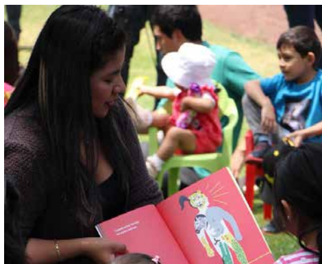
Algunas de las actividades que se realizan durante el Picnic literario.

El Cenart recibió esa iniciativa con el afán de acercar a las familias a los libros y a las historias, para lo cual se instalaron manteles y canastas repletas de libros en diversos formatos e idiomas para que los asistentes disfrutaran y compartieran sus gustos.