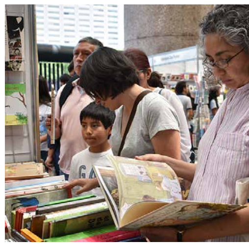
El gran acierto del Gran Remate de Libros es que fomenta la convivencia y la cohesión social.