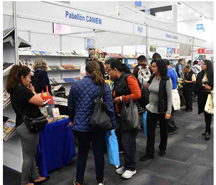
La industria editorial participa en diversas ferias del libro.

El proyecto, que Mayer busca subir al pleno antes de que termine el periodo actual —mas no antes de recibir el visto bueno de la industria—, también contempla establecer el plazo original de 36 meses de garantía para el precio único del libro. Así se evitaría la competencia desleal entre librerías, al garantizar que los libros tengan tiempo suficiente para ser transportados de un lado a otro del país y que puedan llegar costando lo mismo que en su lugar de origen, destacó en su momento Carlos Anaya Rosique ( Reforma , 28/02/2019).