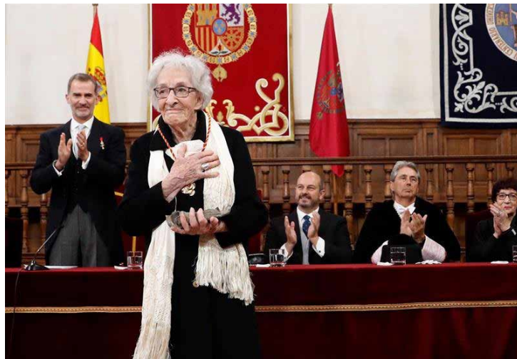
Ida Vitale recibiendo el Premio Cervantes.