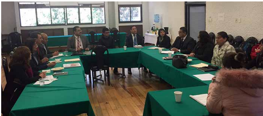
Durante una de las sesiones de evaluación por Competencias.

“Promoción de libros de texto” se fundamenta en criterios rectores de legalidad, competitividad, libre acceso, respeto, trabajo digno y responsabilidad social.