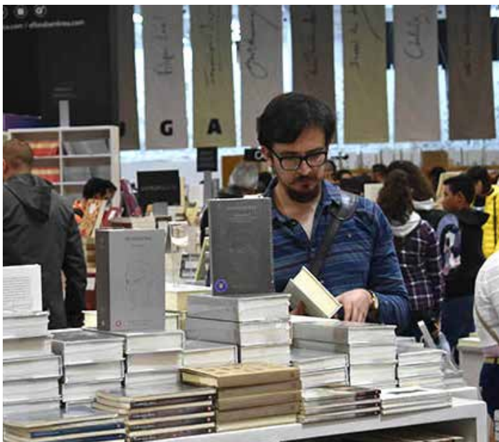
La industria editorial plantea la necesidad de más librerías distribuidas en todo el país.