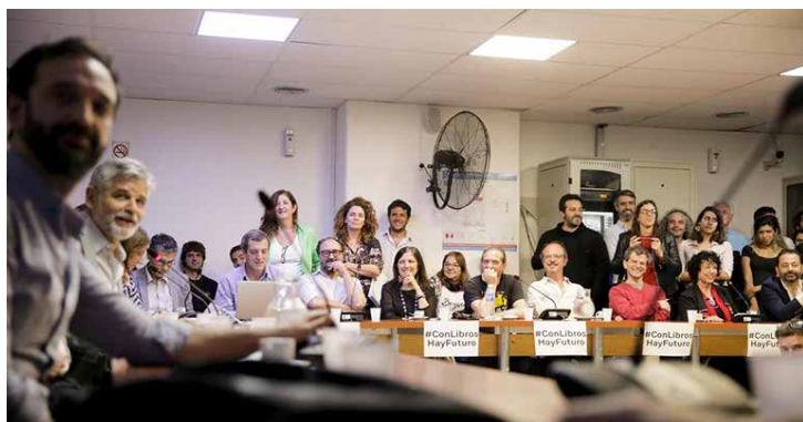
Con amplio apoyo político y de la industria, el proyecto impulsa un organismo estatal como el del cine y el teatro.

* Con información de Lorenzo Herrero / publishnews.es