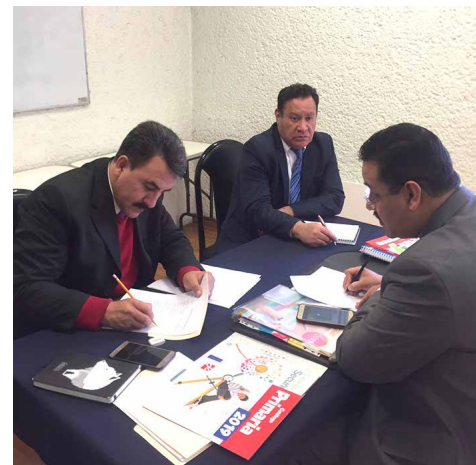
Jornada de trabajo para evaluación por Competencias.

www.conocer.gob.mx/contenido/publicaciones_dof/2019/EC1166.pdf