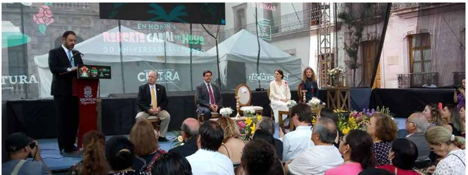
El gobernador Lic. Alejandro Tello Cristerna encabezó el acto protocolario.

* Con información de zacatecasonline.com.mx