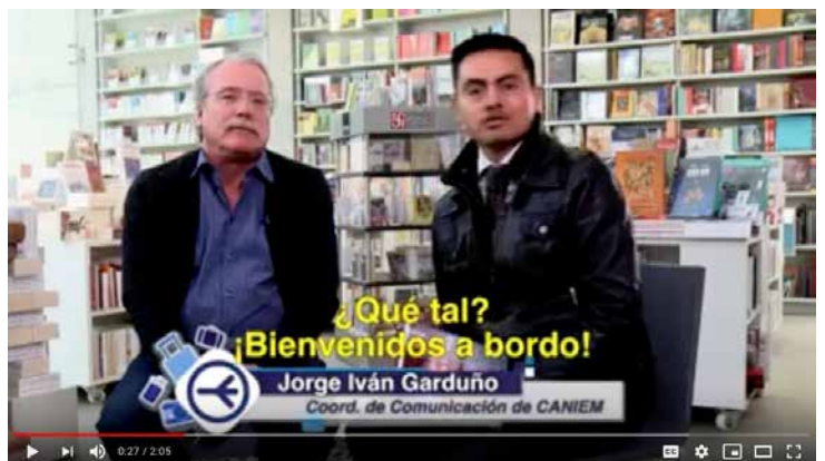
Un viaje en los libros / Interjet Da click a la imagen para ver el video.

A todo ello se suma la presentación de dos importantes informes realizados por el Centro Regional para el Fomento del Libro en América Latina y el Caribe (CERLALC): 'El espacio iberoamericano del libro 2018' y 'En defensa de las librerías. Recomendaciones en materia de políticas públicas, gremiales e individuales para el fortalecimiento de las librerías en Iberoamérica'.