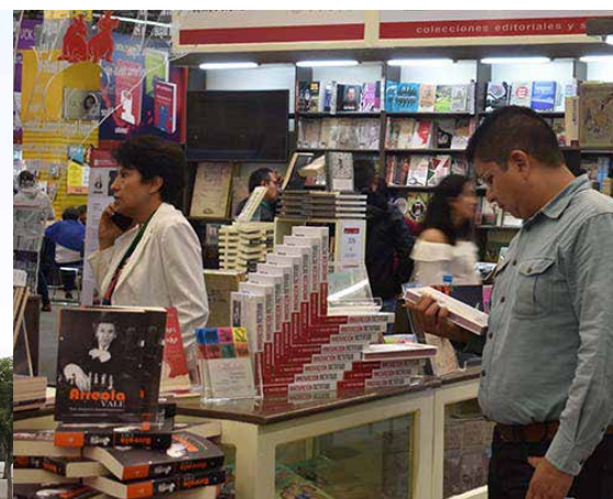
En el Monumento a la Revolución los amantes de los libros se darán cita para el Remate de Libros.