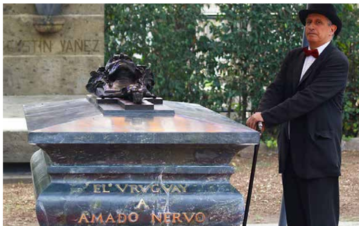
Países latinoamericanos conmemoraron a Amado Nervo.