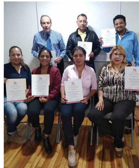
Participantes del curso.