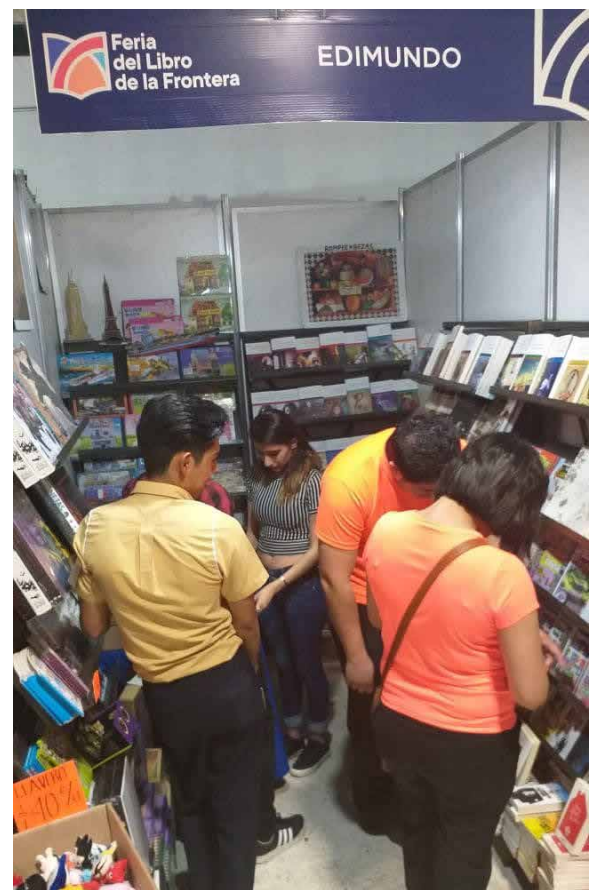
Más de 22 mil personas acudieron a la feria.