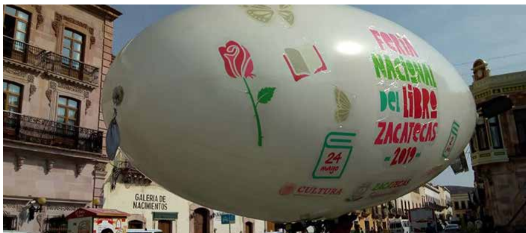
Durante 10 días la ciudad de Zacatecas vivió una fiesta de letras y cultura.

Por la tarde, se llevó a cabo la presentación editorial “La última casa en la montaña”, de Xavier M. Sotelo, texto