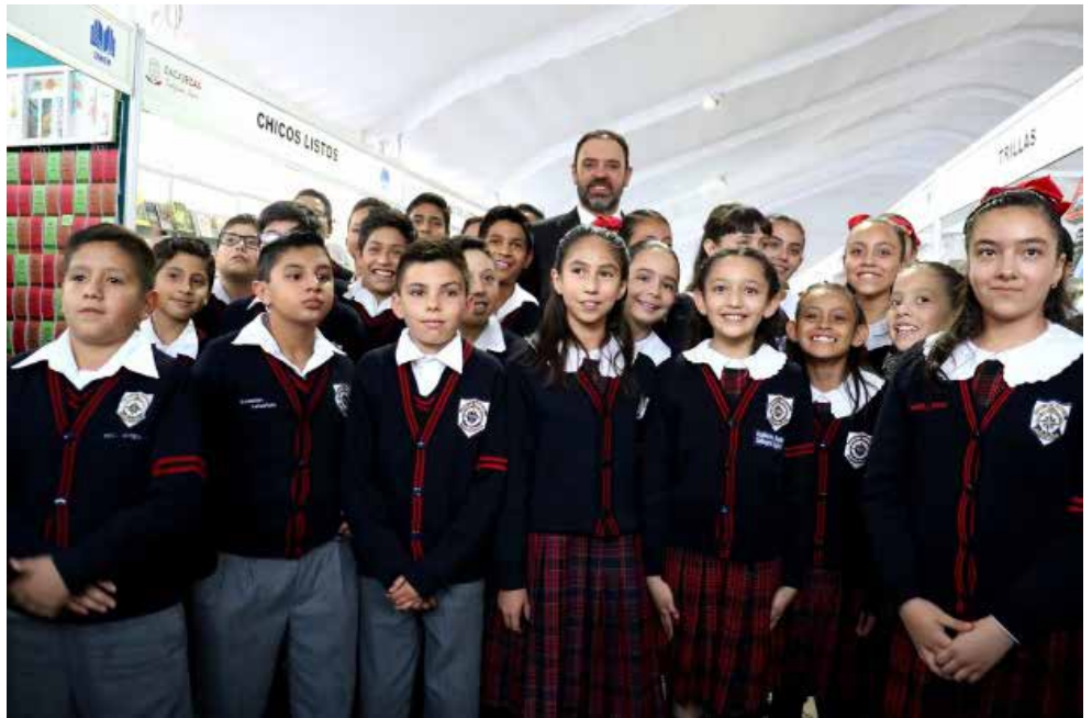
Alejandro Tello Cristerna, gobernador de Zacatecas, junto a estudiantes de primaria zacatecanos.

La agrupación Yucatán A go go llegó luego a la Plaza de Armas para llenar de rock a chicos y grandes con temas que les han colocado en el gusto del público mexicano, como lo han hecho en importantes foros. La actriz Francesca Guillén cerró las actividades de manera formal con la lectura en voz alta, como parte del programa Leo... luego existo, del INBAL.