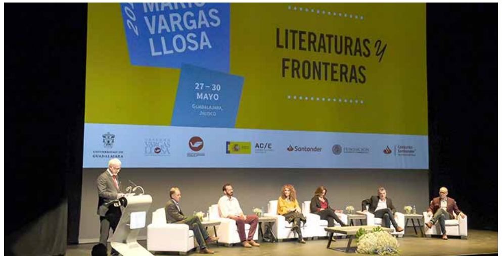
La noche del lunes 27 de mayo se realizó esta charla.

La poeta y novelista Gioconda Belli participa con Las fiebres de la memoria , una novela con una mirada íntima hacia el reto de reinventarse una identidad y aceptar una segunda oportunidad; conjuga