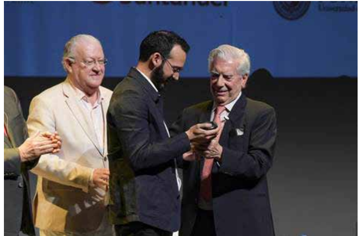
Mario Vargas Llosa entregando el reconocimiento al ganador.

Dijo que, además del “honor” de que su nombre esté ligado al del escritor peruano Mario Vargas Llosa, recibir el premio significa la oportunidad de que