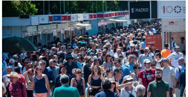
Feria del Libro 2019 en su primer fin de semana.

Son miles los madrileños y turistas que se han acercado este domingo a que sus autores favoritos les firmen ejemplares de sus libros. "Hace 15 años que vengo y hoy veo muchísima gente", explica un asistente, seguramente porque "acompaña el tiempo" aunque "la gente siempre viene, aunque llueva".