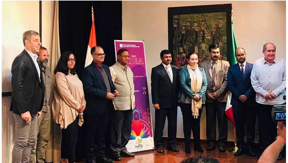
La delegación de FIL Guadalajara y la Embajada de la India en México dieron los pormenores de la feria.

Representantes del National Book Trust, la Embajada de India, el Instituto Nacional de Diseño y el Centro Cultural Indio Gurudev Tagore se encuentran en México para cerrar los detalles de su participación en esta edición de la FIL Guadalajara, del 30 de noviembre al 8 de diciembre próximos, en Expo Guadalajara. El programa completo de actividades de India será dado a conocer en las semanas siguientes, en la página web y las redes sociales de la FIL Guadalajara.