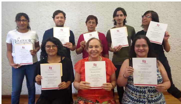
Grupo de participantes del curso-taller.

Silvia Peña-Alfaro es Licenciada en Lengua y Literaturas Hispánicas con grado de maestría en Lingüística Hispánica por la UNAM. A partir de 1984 es