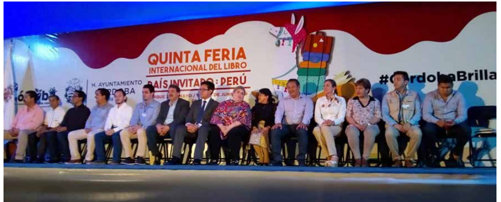
Integrantes del presidium durante la inauguración de la feria.

En dicha Feria, que se llevará a cabo del 6 al 16 de junio, estarán presentes 40 editoriales que ofertarán libros a bajo costo, indicó el funcionario municipal, quien agregó que la intención es fomentar la lectura, con precios accesibles para obtener un libro.