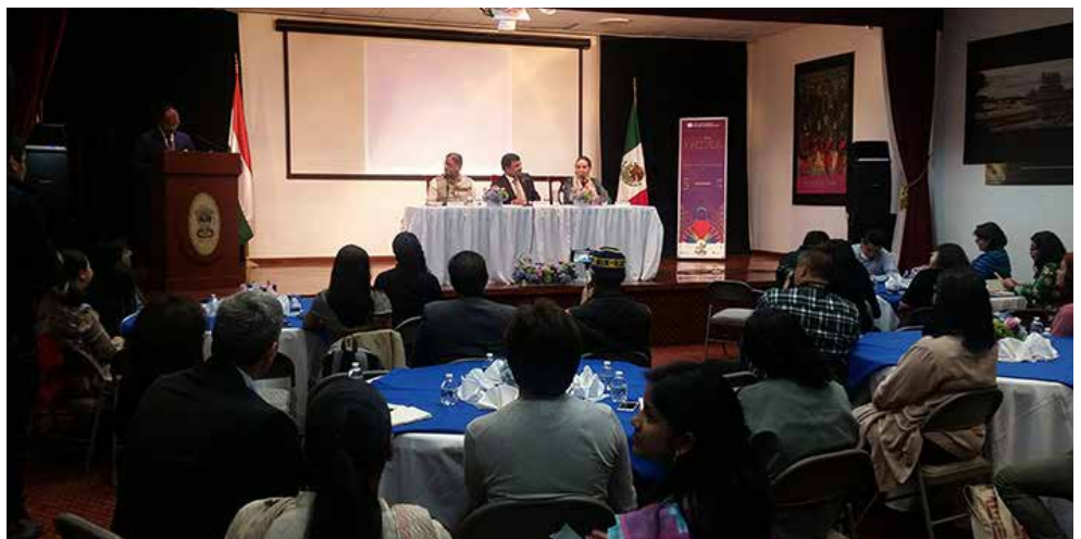
Diversos medios de comunicación acudieron a la invitación.