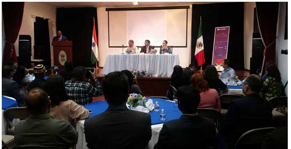
Su excelencia Muktesh Pardeshi, embajador de la India en México, encabezó la presentación.