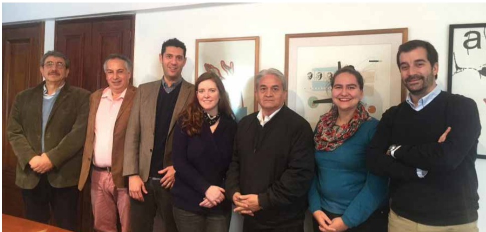
Representantes de las asociaciones del libro de Chile.

* Con información de Lorenzo Herrero / publis-hnews.es