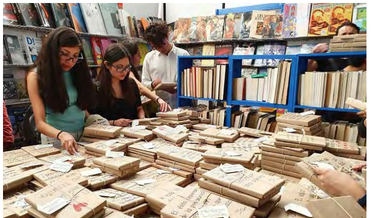
Las ofertas son permanentes y generales en toda la feria del Remate.

* Con información de la Secretaría de Cultura de la Ciudad de México