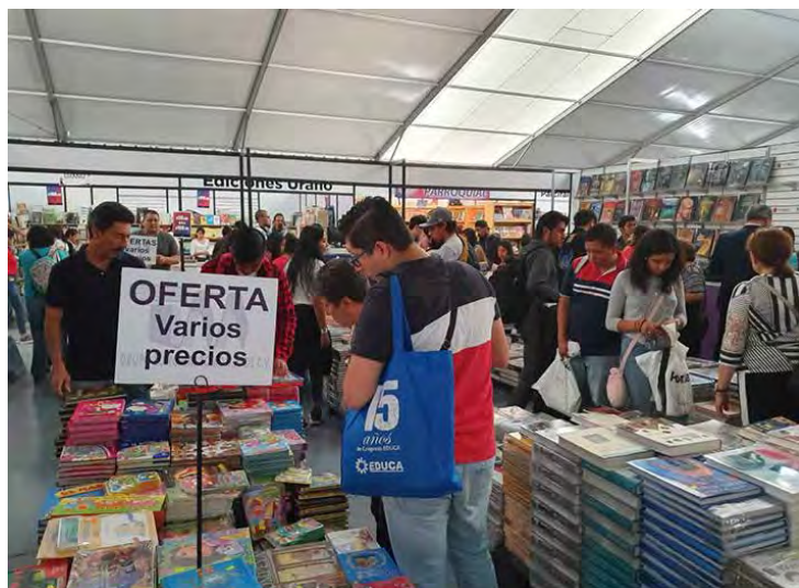
Se ofertan libros para todo tipo de lectores y con precios accesibles.