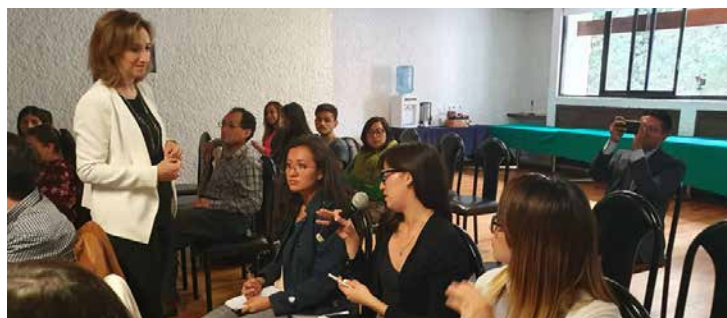
Los asistentes tuvieron la oportunidad de hacer preguntas sobre sus experiencias directas.