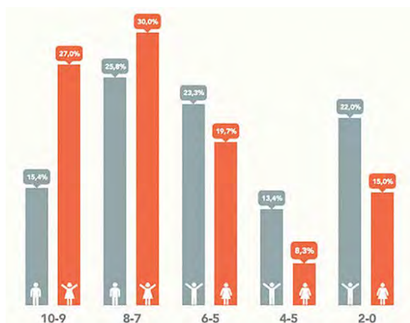
Gráfico: FGSR. Fuente: “Encuesta de Hábitos y Prácticas Culturales en España” (2018). Ministerio de Cultura y Deporte

“Cuando se pregunta sobre el interés por la lectura literaria en tiempo de ocio en España, se aprecia que en la población femenina española hay un segmento de lectoras muy convencidas, frente a una distribución más repartida en las puntuaciones que muestran una mayor indiferencia en el caso de los hombres”, destaca la fundación. Lo muestra, según una escala del 0 al 10, el siguiente gráfico.