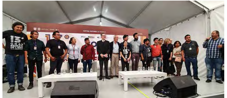
Todo el equipo de la Secretaría de Cultura de la CDMX y de la CANIEM que participan en la organización del Remate de Libros.

“Más de 200 promotores culturales y mediadores de la lectura estarán participando, así como los programas de la Ciudad de México Libro Club, de Artes y Oficios, y festivales de barrio”, anunció.