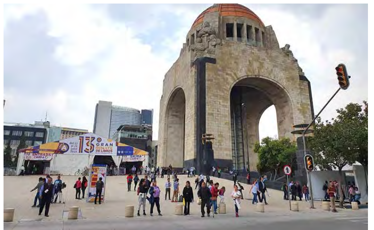
El Monumento a la Revolución es testigo de la décima tercera edición del Gran Remate de Libros.