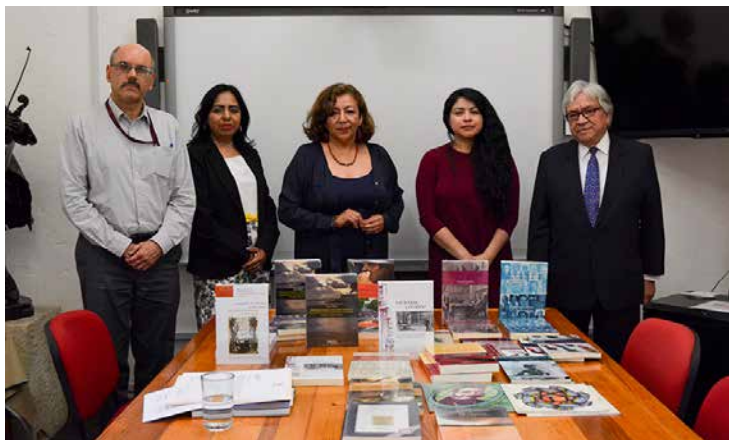
Firma de la donación.