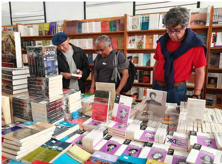
El público asistente podrá encontrar una gran oferta literaria.