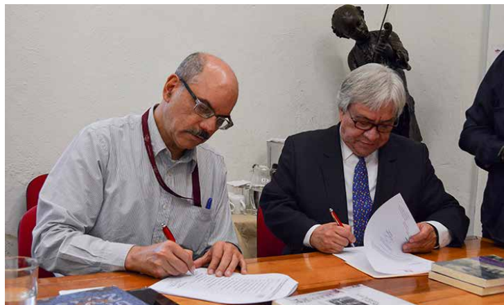
Firma de la donación.

zados y de formación que ha desarrollado desde su creación. Entre los títulos que fueron donados a este centro se encuentran ediciones de los investigadores del propio instituto sobre diversos temas como la historia de la imprenta en México, los editores en México y Francia, historia de la prensa, análisis del discurso visual, lectura en México y prácticas culturales, entrevistas y testimonios.