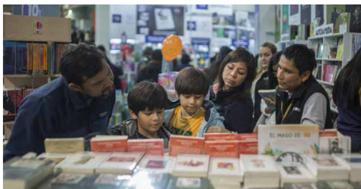
FIL LIMA 2019.