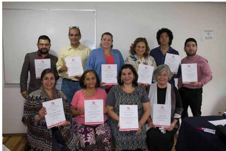
Los participantes del curso al término del mismo.

Quienes tuvieron la oportunidad de reforzar sus conocimientos sobre el tema fueron integrantes de las siguientes instituciones: Andamio Educativos, Editorial Planeta, Editores Mexicanos Unidos, Editorial Un mensaje de Amor y Esperanza, Editorial Escalante, Sindicato Nacional de Trabajadores de la Educación, Instituto de Investigaciones Dr. José María Luis Mora, además de trabajadores independientes de la industria editorial interesados en su capacitación.