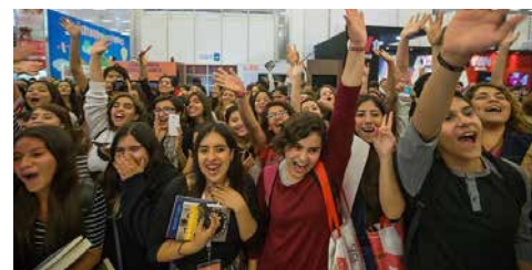
Booktubers en el módulo de firmas, dentro de la Feria Internacional del libro en Guadalajara, México, Jueves, Diciembre 3, 2015.