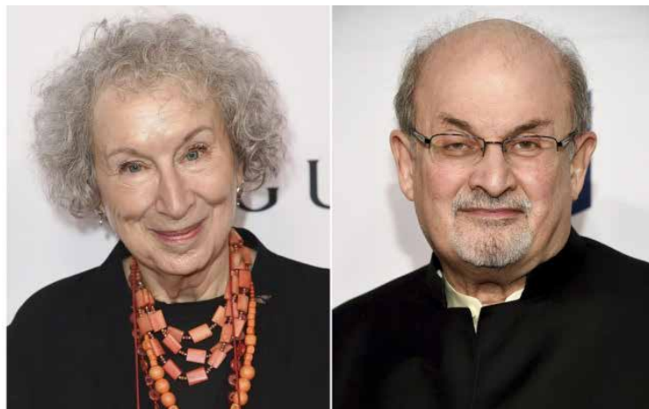
Margaret Atwood y Salman Rushdie.

Completan la lista de finalistas el nigeriano Chigozie Obioma por An Orchestra of Minorities , que también fue finalista en 2015; la escritora francesa de origen turco Elif Shafak por 10 minutos 38 segundos in This Strange World ; la británica Bernardine Evaristo por Girl, Woman, Other ; y la estadounidense Lucy Ellmann, por Ducks, Newburyport . Fuera de esta última selección se ha quedado la mexicana Valeria Luiselli que se encontraba entre los 13 nominados a finales del mes de julio.