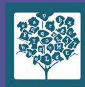
Feria Internacional del Libro Monterrey 12 a 20 de octubre de 2019