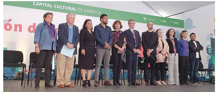
El secretario de Cultura de la CDMX, José Alfonso Suárez del Real y Aguilera, encabezó la inauguración.

El secretario de Cultura local comentó que este año en la FIL Zócalo participarán 380 autores, 176 mujeres y 204 hombres, por lo que se comprometió a una representatividad del cincuenta por ciento para ambos en la siguiente edición. “Apoyaremos desde todas las plataformas que dispongamos, para lograr la transformación de las prácticas patriarcales de los gremios culturales y la gestación de una nueva contra narrativa que permita que todas reescriban el futuro”, subrayó.