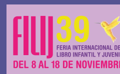
Feria Internacional del Libro Infantil y Juvenil 8 a 18 de noviembre de 2019