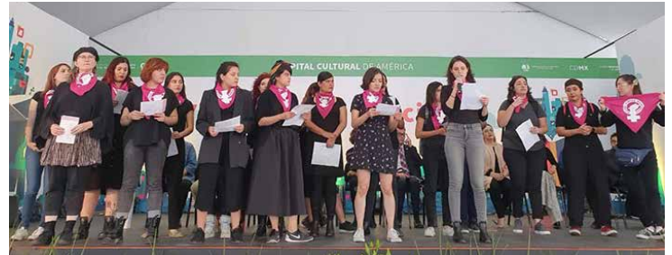
El colectivo "Mujeres Juntas Marabunta" realizaron una declaración en pro de la equidad.

La XIX Feria Internacional del Libro en el Zócalo 2019, que impulsa y garantiza los derechos culturales de los habitantes y visitantes de la Ciudad de México, es organizada por el Gobierno local, a través de Grandes Festivales