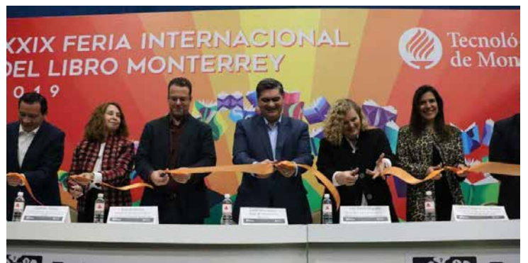
Inauguración de la edición número 30 de la FIL de Monterrey.

Además, destacó que en las 29 ediciones de la FIL más de 5 millones de personas han visitado el evento librero de Monterrey. En la inauguración estuvieron presentes autoridades de Conarte, del Festival Internacional de Santa Lucía y del Tecnológico de Monterrey. Durante el sábado se estarán presentando autores como Mónica Lavín, Marina Perezagua, Gabriela Riveros, Julio Ortega, Diego Petersen, Julio Patán y Leonardo Boff.