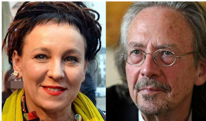
Olga Tokarczuk y Peter Handke.

* Con información de Andrés Seoane / elcultural.com