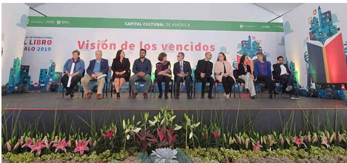
En la carpa "Visión de los vencidos" se realizó el acto inaugural.

Momentos antes, el colectivo Mujeres Juntas Marabunta, vestidas de negro y con pañoleta rosa, realizaron un pronunciamiento en el que exigieron un alto a la violencia machista, y demandaron perspectiva de género en el ámbito literario, difusión del trabajo literario realizado por mujeres, sororidad y apertura de espacios dedicados a la lectura para las mujeres, así como erradicación de prácticas patriarcales en el gremio cultural.