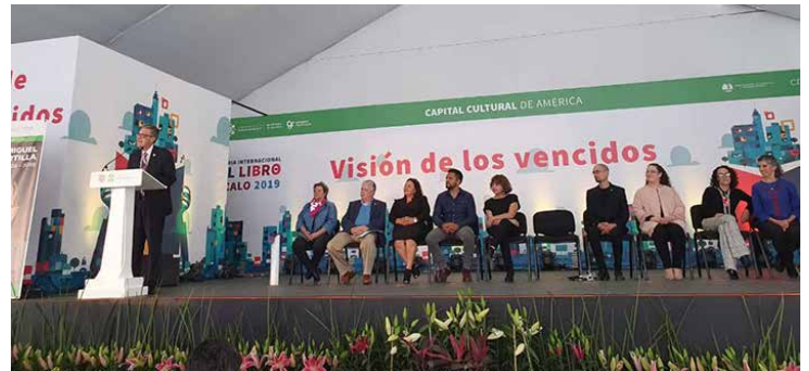
Suárez del Real celebró la realización de este tipo de eventos en la Ciudad de México.

Comunitarios de la Secretaría de Cultura capitalina. Consulte la programación completa y horarios en www.filzocalo.cdmx.gob.mx