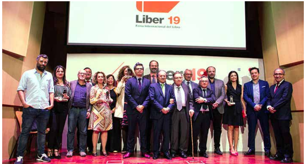
Galardonados en Liber 2019.

Alrededor de 400 empresas de 17 países han mostrado sus principales novedades y han convertido a LIBER en un exponente de la apuesta por la bibliodiversidad del sector editorial. Asimismo, ha reflejado el interés de las empresas editoriales