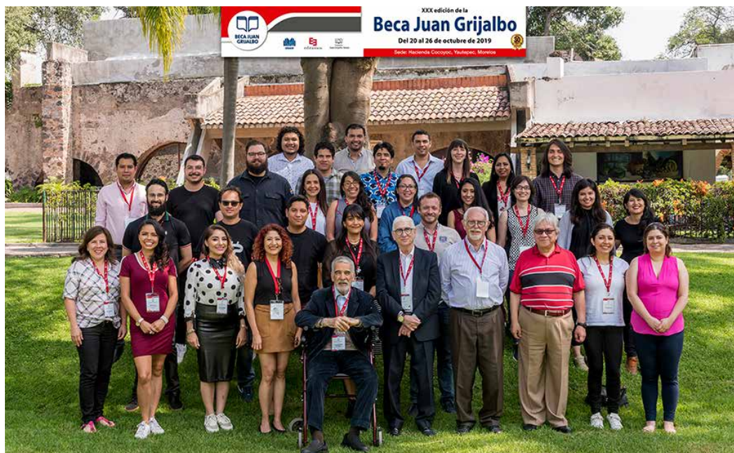
La generación xxx de la Beca Juan Grijalbo.

Las exposiciones lograron dar un panorama completo de la situación de la industria, de sus sectores, de su desarrollo. Permitieron que los estudiantes