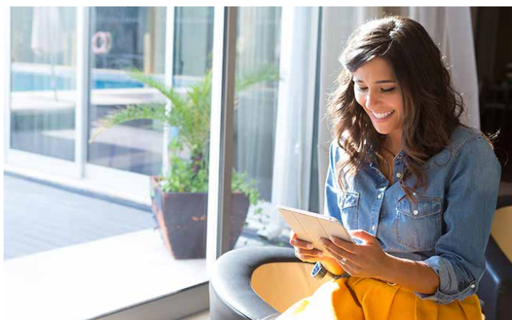
Llega Scribd a México.

Scribd actualmente tiene más de 1 millón de suscriptores de pago y atrae a más de 100 millones de visitantes únicos a su plataforma mensualmente. El catálogo completo incluye más de 1 millón de títulos premium y 80 millones de documentos, y hasta la fecha, los lectores han dedicado 190 millones de horas de lectura en la plataforma.