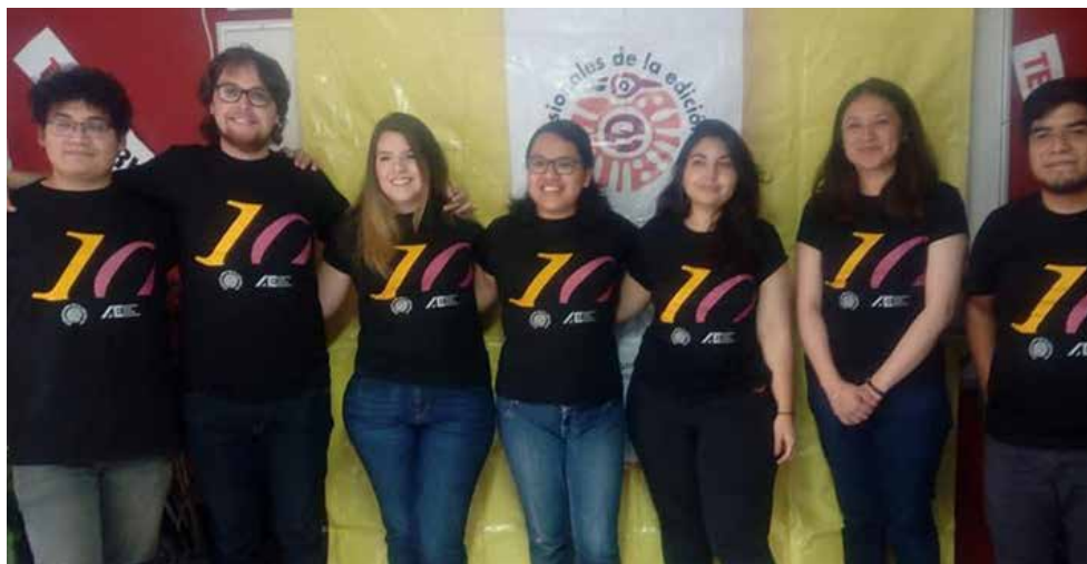
Estudiantes del Diplomado de Corrección de PEAC.

*Con información de Guadalupe López García / semmexico.mx