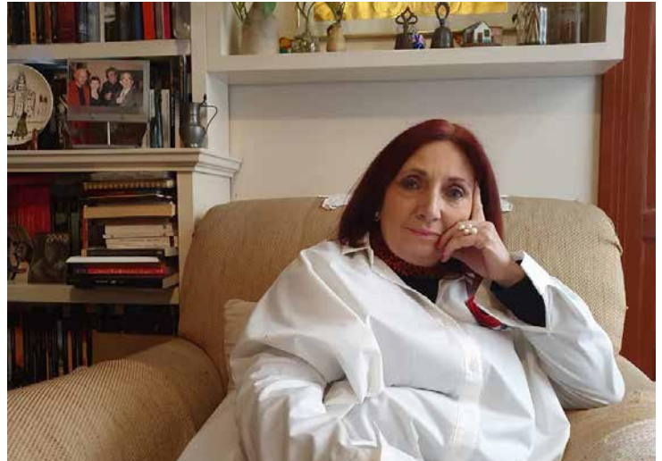
Desde 2013, Marisol Schulz es la Directora General de la Feria Internacional del Libro de Guadalajara.

Eso ya te da un abanico de posibilidades enorme, porque 2 300 casas editoras te brindan catálogos editoriales diversos, en todos los formatos y de todas las latitudes. Así que la posibilidad de lectura se multiplica por 400 mil, como visitante ese recorrido por los stands de la feria vale la pena. Además, para todas aquellas personas que nos visiten por primera ocasión o bien, los que sean asiduos visitantes a la FIL de Guadalajara, tienen que consultar el programa para ver qué se está ofreciendo, ya que la feria nunca es la misma, año con año la feria cambia, es una feria completamente diferente, el Invitado de Honor cambia y los programas literarios son diferentes, ya que, aunque tengan el mismo nombre, los galardonados o invitados son distintos, por lo que tienen otras intenciones las actividades. Tenemos áreas temáticas como el Salón del Cómic y la Novela Gráfica, tenemos el Pabellón Gastronómico Libros al Gusto, tenemos FIL Niños, FIL Joven que es un espacio con actividades para jóvenes, todo esto habla de que lo