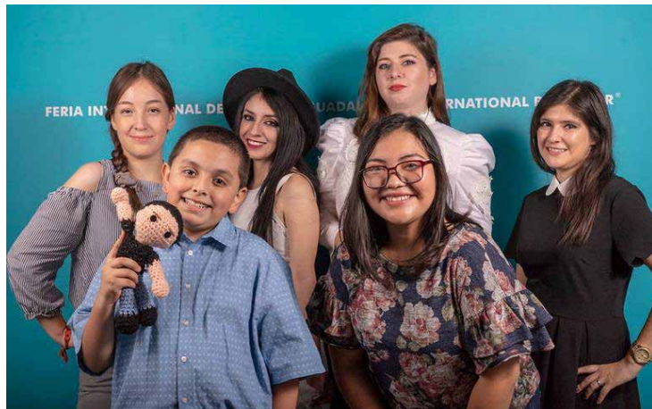
Participantes del encuentro de Booktubers.