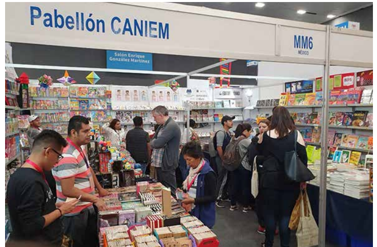
El pabellón CANIEM fue uno de los stands más concurridos de la feria.