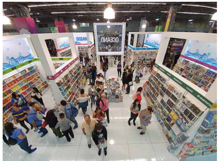
En todo momento, los asistentes no dejaron de llegar a la FIL.