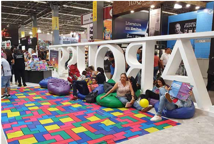
En algunas zonas se podía descansar simplemente para leer un buen libro.