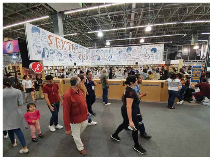
Los visitantes a la FIL acudieron, en muchos casos, en familia.

Al hacer su balance general de la Feria, Schulz Manaut subrayó el perfil diverso e incluyente de la Feria, e hizo hincapié en la instalación del Módulo de la Defensa de Derechos Universitarios, que atendió cuatro quejas, impartió 23 pláticas de asesoría y 27 charlas preventivas. La directora de la FIL también hizo un recuento de las iniciativas que ha venido realizando la FIL para reducir su impacto ambiental, que incluyen un plan de manejo de residuos, el uso de materiales reciclados y el servicio de transporte masivo gratuito. Concluyó afirmando que la FIL “ha sido más multicultural y multilingüe que nunca. Pocas cosas logran mover tantas fronteras como un libro y eso lo celebramos todos”.