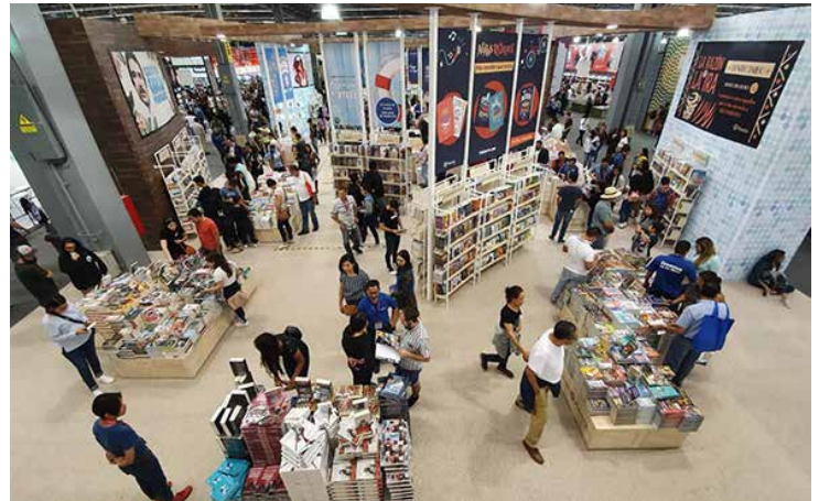
Cientos de visitantes recorrieron las ofertas literarias de la FIL de Guadalajara.