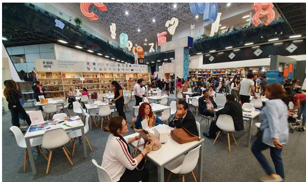
El pabellón de la India fue uno de los espacios más visitados en la FIL de Guadalajara.