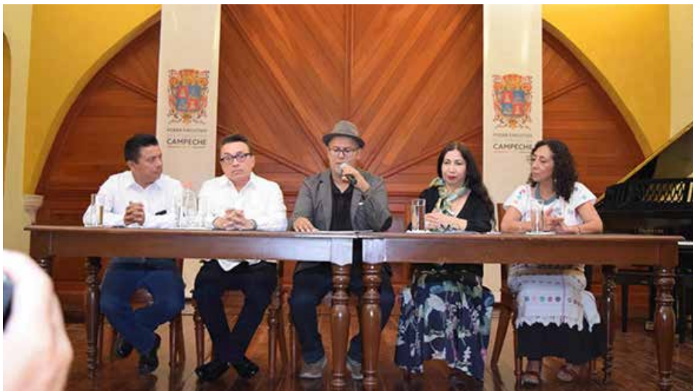
Durante la entrega del Premio Juan de la Cabada.