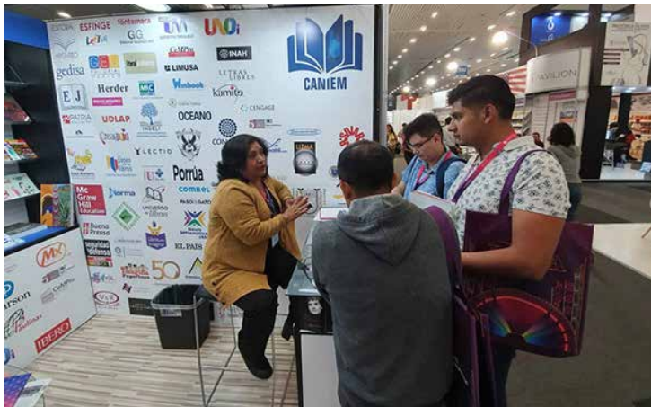
El stand institucional de la CANIEM ofreció asesoría a editores interesados en la Cámara.