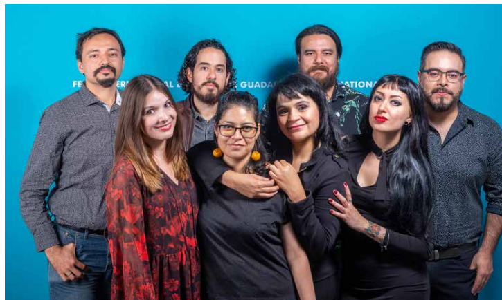
Los representantes de Al ruedo, ocho talentos mexicanos.