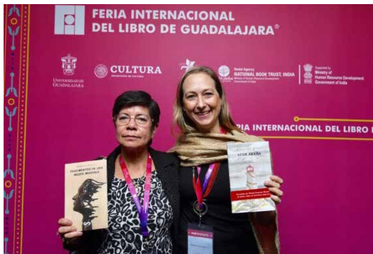
Ganadoras del Concurso Nacional de novela corta de escritoras mexicanas.

* Con información de heraldodemexico.com.mx