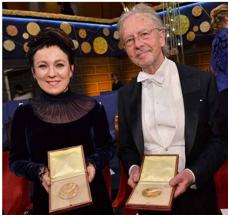
Peter Handke y Olga Tokarczuk, laureada de 2018, posan con el galardón en Estocolmo.

Tras la ceremonia de entrega de los premios, entre 500 y mil personas se reunieron en pleno centro de Estocolmo para una manifestación anti-Handke, blandiendo banderas bosnias y portando brazaletes blancos, como los que