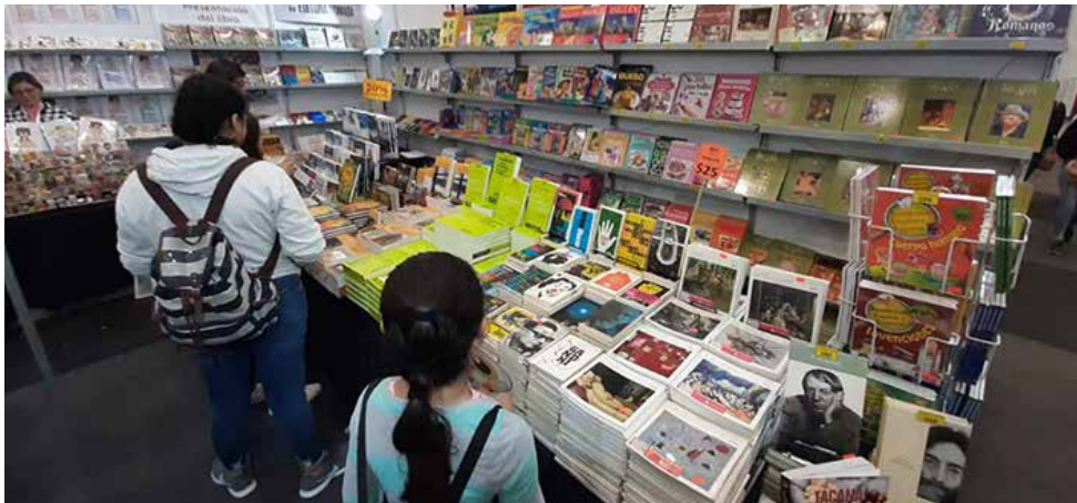
Stand de la CANIEM en la FIL Guadalajara 2019.

De esta forma, la CANIEM contribuye a hacer más grande tu negocio.