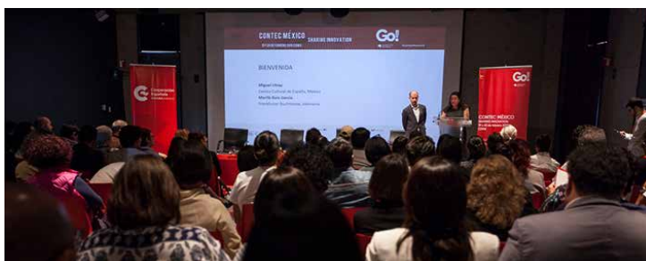
CONTEC es organizada por los responsables de la Feria de Frankfurt.