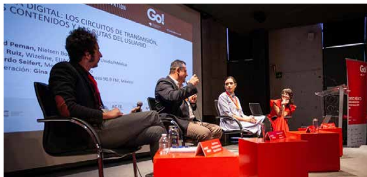
Durante dos días, expertos en industrias creativas y de contenido en torno a la industria editorial se darán cita en la CDMX.

tivas transmedia y sus posibilidades, desde el performance de poesía para atraer nuevos públicos, hasta el storytelling inmersivo para atrapar audiencias. Entre otros, participan la mexicana Rocío Cerón y los españoles Belén Santa-Olalla (Transmedia Storyteller Ltd), Rodrigo de la Calva (Stroke114) y Roger Casas-Alatraste (El Cañonazo Transmedia).