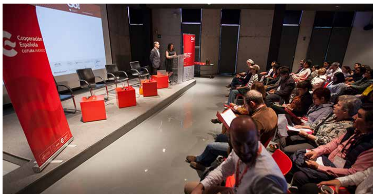
Por cuarta ocasión se efectuará CONTEC en la Ciudad de México.

El martes 18 de febrero, los keynotes y mesas redondas girarán en torno a proyectos y casos de negocio que se han desarrollado en torno a las narra-