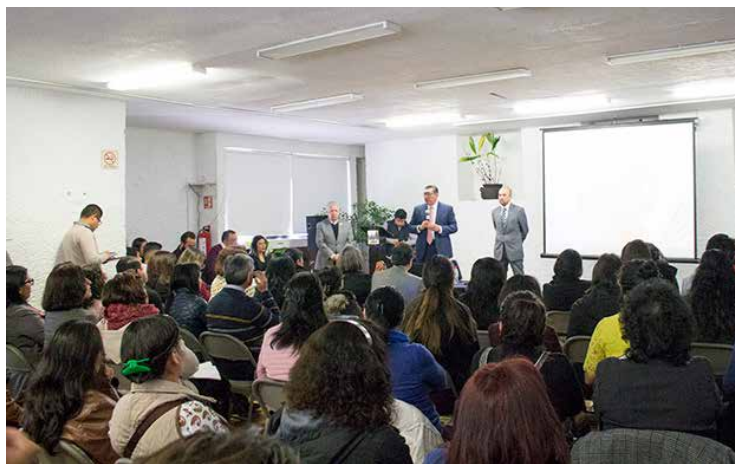
Más de 120 personas acudieron al taller convocado por la CANIEM e impartido por el INDAUTOR.