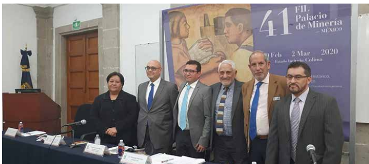
La Feria Internacional del Libro del Palacio de Minería es la feria más antigua del país.

La Feria se ha consolidado a lo largo de cuatro décadas por la diversidad y pluralidad de sus espacios temáticos; en esta edición se llevarán a cabo: la quinta Jornada de Literatura de Horror en homenaje al centenario del nacimiento de Ray Bradbury; el noveno Ciclo de Equidad de Género; la sexta Jornada de Novela Negra; el decimotercero Ciclo Científico: Encuentro con la ciencia en Palacio; el decimotercero Ciclo de Poesía Nacional: Poéticas de diversas latitudes y las decimosextas Jornadas Juveniles.