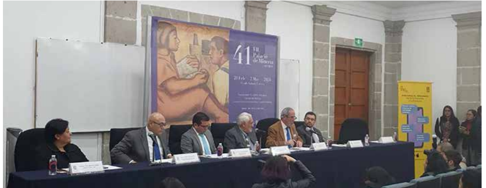
El anuncio se hizo el pasado 5 de febrero en el Palacio de Minería, ante medios de comunicación.