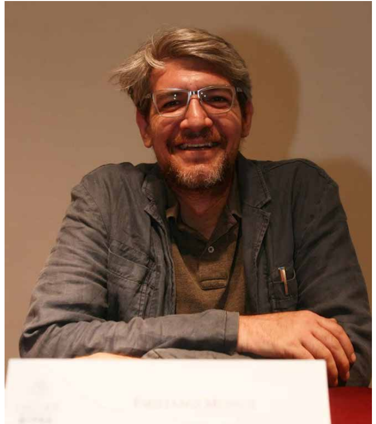
Emiliano Monge.

Nacido en la Ciudad de México el 6 de enero de 1978, Emiliano Monge se formó como politólogo y narrador. Estudió Ciencias Políticas en la Universi-