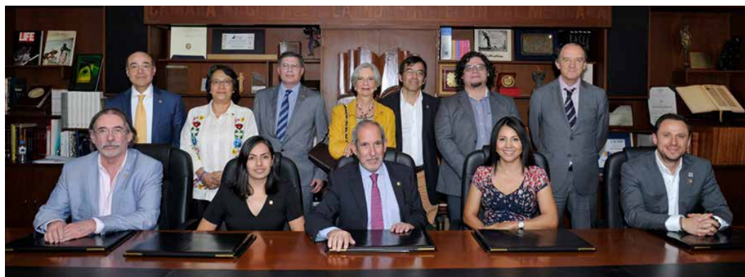
Consejo Directivo de la CANIEM.

Agradecemos de antemano su atención y comprensión.