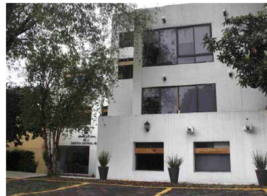
Cámara Nacional de la Industria Editorial Mexicana.

Sin embargo, la Cámara no es ajena a las complicaciones que el confinamiento obligatorio ha acarreado. Por eso, ahora es la CANIEM la que solicita de su apoyo estimado editor, distribuidor y adherente. Es en estos momentos cuando se pone a prueba la unidad gremial. Parte del apoyo que solicitamos es que compartan la información de sus editoriales o librerías, cuando lo requerimos, pues ello nos dará la oportunidad de entender la situación real de la industria y nos ayudará a establecer estrategias confiables y oportunas para apuntalar de nuevo nuestro gremio.