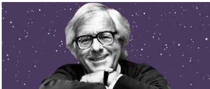
Ray Bradbury.