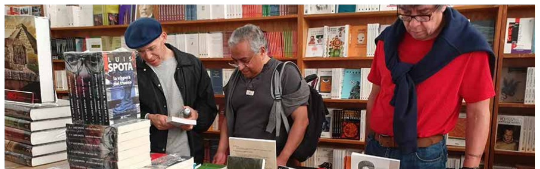
Esta contingencia sanitaria es una gran oportunidad para leer en casa.

Asimismo, invitamos a nuestros editores a compartir las actividades alternas que realizarán en esta temporada para sumarlos a esta lista. Esperamos contar con su apoyo y participación. De antemano, gracias por su compromiso con México.