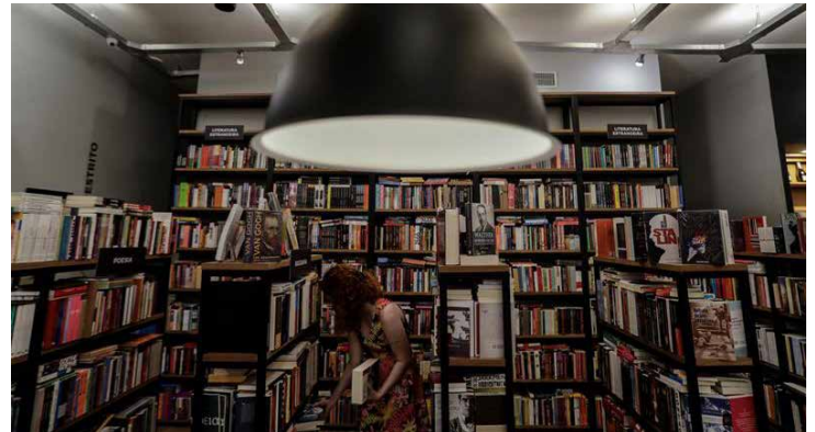
En 2021, Brasil registró ventas de 55 millones de libros

De acuerdo con un reporte de Brazilian Publishers, Brasil es el sexto país con el mayor número de usuarios de internet (149 millones de personas conectadas a internet). Para Pansa, esto demuestra “la importancia de lo digital en la recuperación del mercado editorial post-pandemia”.