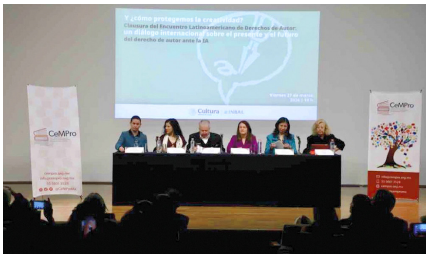
La especialista advirtió sobre la competencia desleal por la caída en contrataciones por el uso de voces artificiales que están basadas en grabaciones de las propias voces de los artistas.

“Y lo mismo está pasando con los traductores, pero también con los ilustradores y fotógrafos. Esto se está volviendo en todo un sistema de sustitución de trabajo artístico”, lamentó.