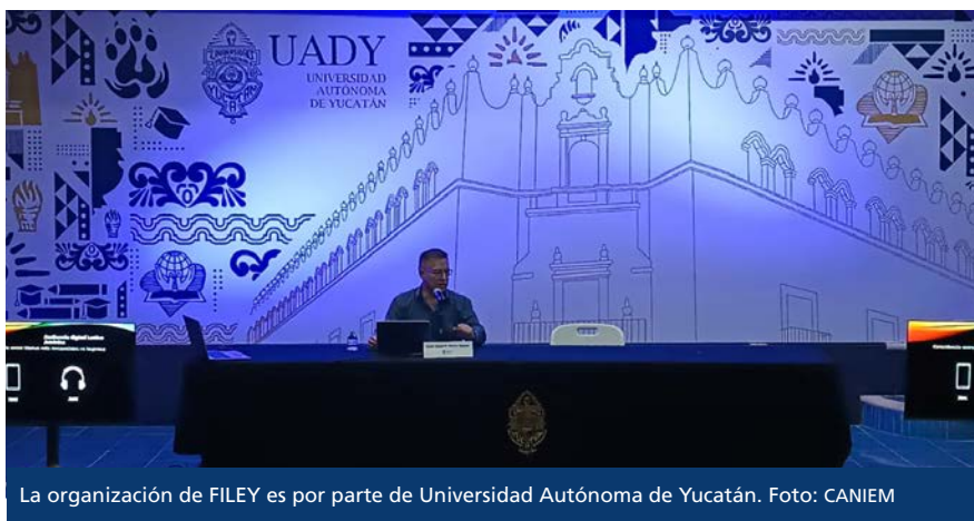
La organización de FILEY es por parte de Universidad Autónoma de Yucatán.