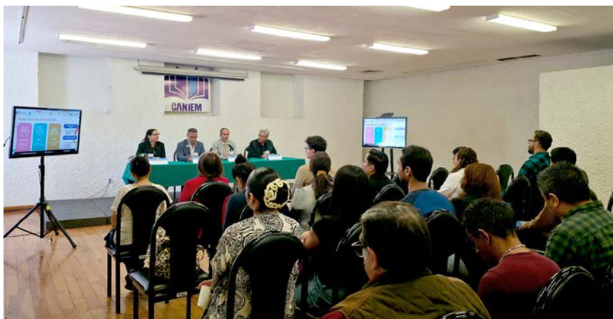
Contamos con la participación de más de 30 editoriales y 40 asistentes