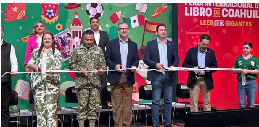
Seguimos presentes en los encuentros que hacen crecer al libro y a su comunidad.