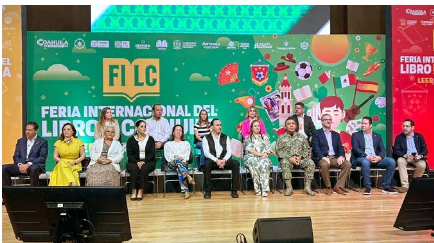
Inauguración de la Feria Internacional del Libro de Coahuila.