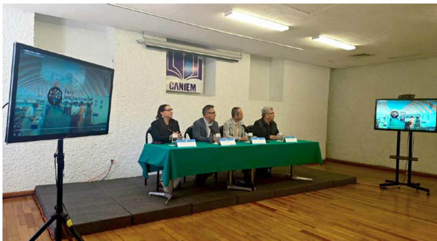
Se compartieron costos, espacios, bases de participación y beneficios exclusivos.