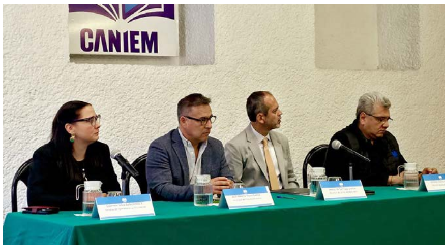
Presentación de la Feria Internacional del Libro Monterrey, en CANIEM.

Durante la sesión, nuestras editoriales afiliadas pudieron conocer costos, espacios, bases de participación y beneficios exclusivos, como descuentos del 10% al 15% y la opción de integrarse al stand colectivo. Con la participación de más de 30 editoriales y 40 asistentes, este encuentro se convirtió en un espacio clave para resolver dudas, generar conexiones y explorar nuevas oportunidades dentro de uno de los eventos editoriales más importantes del país. Seguimos impulsando espacios que conectan e impulsan a nuestra industria